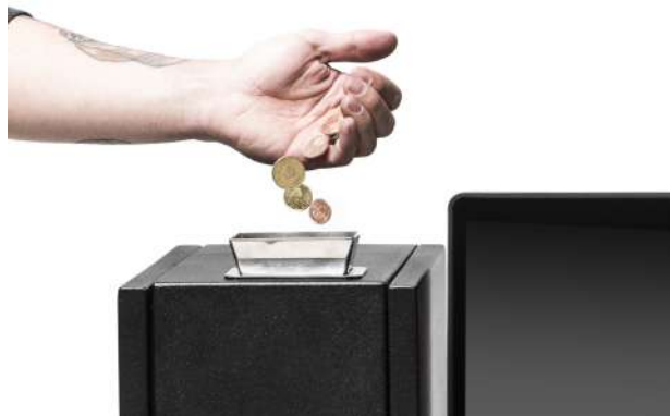
Accepte et vérifie jusqu'à 6 monnaies par seconde