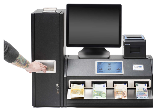
Revenir à 15 monnaies par seconde