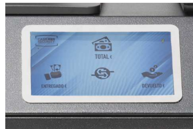
Affichage intégré à haute luminosité