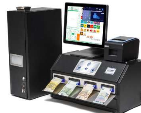
Accepte et vérifie plusieurs billets simultanément