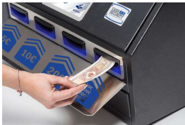
Multidevise, accepte et vérifie toutes les billets