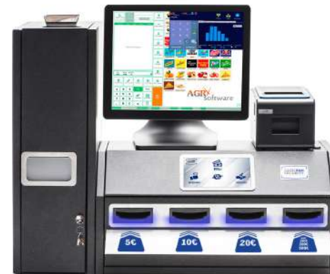
Compatible avec tous les logiciels du marché et toutes les plateformes