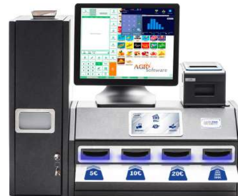
Compatible con todos software del mercado y todas las plataformas